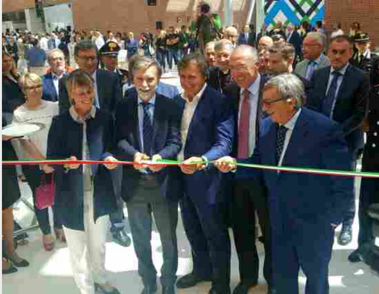
Il taglio del nastro al Marco Polo di Venezia

VENEZIA - Il nuovo ampliamento del Terminal passeggeri dell'aeroporto Marco Polo di Venezia è stato inaugurato oggi, 17 giugno, nel corso di una cerimonia alla presenza del Presidente di SAVE, Enrico Marchi , del Ministro delle Infrastrutture e dei Trasporti, Graziano Delrio , del Sindaco di Venezia, Luigi Brugnaro , dell'Assessore alle Infrastrutture e Trasporti della Regione Veneto, Elisa De Berti e del Presidente di ENAC, Vito Riggio .