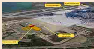
LOGISTICA | 13 aprile 2016 Nuovo gateway Dhl all'aeroporto Marco Polo di Venezia

A caratterizzare il piano una copertura metallica, costituita da un graticcio di travi bidirezionali in acciaio rivestite e vetri piani che seguono l'andamento curvilineo attraverso un sistema di curvatura chiamato "cold bending". La scelta tecnologica di adottare l'acciaio e il vetro come materiali base ha permesso di creare un edificio che ben si colloca architettonicamente all'interno degli edifici esistenti rivestiti in mattoni faccia a vista. Al centro un grande waterwall, un muro d'acqua di marmo nero Zimbabwe, riprodotto in proporzioni più ridotte anche in due differenti spazi al piano arrivi.