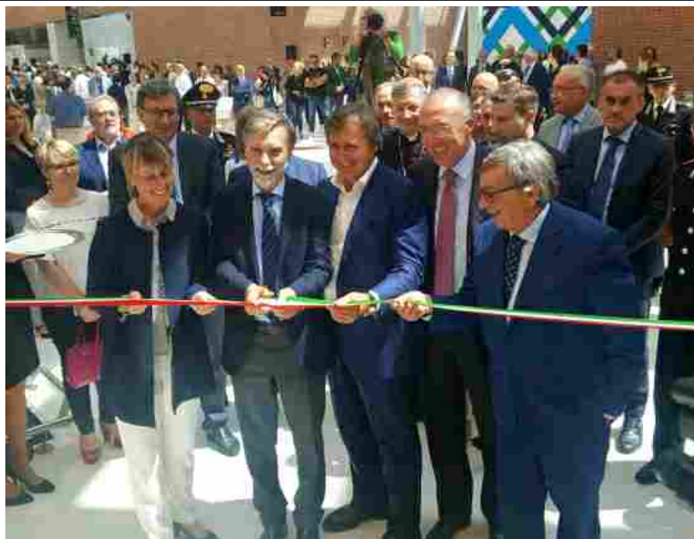
Il taglio nel nastro al Marco Polo di Venezia

VENEZIA - Il nuovo ampliamento del Terminal passeggeri dell'aeroporto Marco Polo di Venezia è stato inaugurato oggi, 17 giugno, nel corso di una cerimonia alla presenza del Presidente di SAVE, Enrico Marchi , del Ministro delle Infrastrutture e dei Trasporti, Graziano Delrio , del Sindaco di Venezia, Luigi Brugnaro , dell'Assessore alle Infrastrutture e Trasporti della Regione Veneto, Elisa De Berti e del Presidente di ENAC, Vito Riggio .