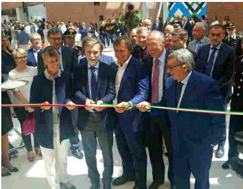
Il taglio ndel nastro al Marco Polo di Venezia

VENEZIA - Il nuovo ampliamento del Terminal passeggeri dell'aeroporto Marco Polo di Venezia è stato inaugurato oggi, 17 giugno, nel corso di una cerimonia alla presenza del Presidente di SAVE, Enrico Marchi , del Ministro delle Infrastrutture e dei Trasporti, Graziano Delrio , del Sindaco di Venezia, Luigi Brugnaro , dell'Assessore alle Infrastrutture e Trasporti della Regione Veneto, Elisa De Berti e del Presidente di ENAC, Vito Riggio .