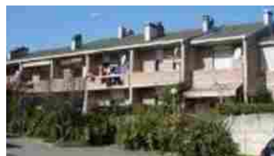
Appartamenti Pieve di Soligo Via Sabin 21