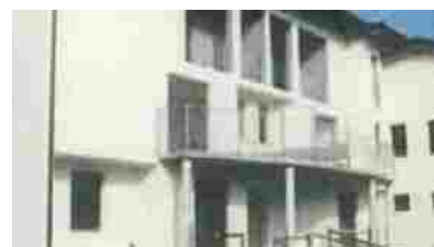
Appartamenti Albuzzano delle Rose